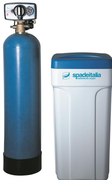
Serie "RUBINO HW"

Le informazioni contenute nella presente scheda tecnica riflettono il nostro attuale livello di conoscenza tecnica e di esperienza. Non costituiscono una garanzia legale di particolari caratteristiche o di idoneità per uno scopo specifico e non esenta l'utente dall'effettuare le proprie verifiche e di adottare le opportune misure cautelative.