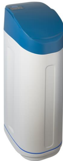
serie “ ZAFFIRO CS6 ”

Le informazioni contenute nella presente scheda tecnica riflettono il nostro attuale livello di conoscenza tecnica e di esperienza. Non costituiscono una garanzia legale di particolari caratteristiche o di idoneità per uno scopo specifico e non esenta l'utente dall'effettuare le proprie verifiche e di adottare le opportune misure cautelative.